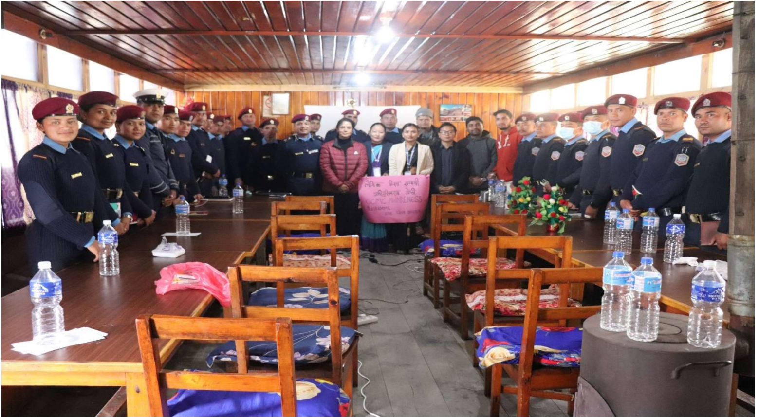
OCMC सम्बन्धित अभिमुखिकरण कार्यक्रम