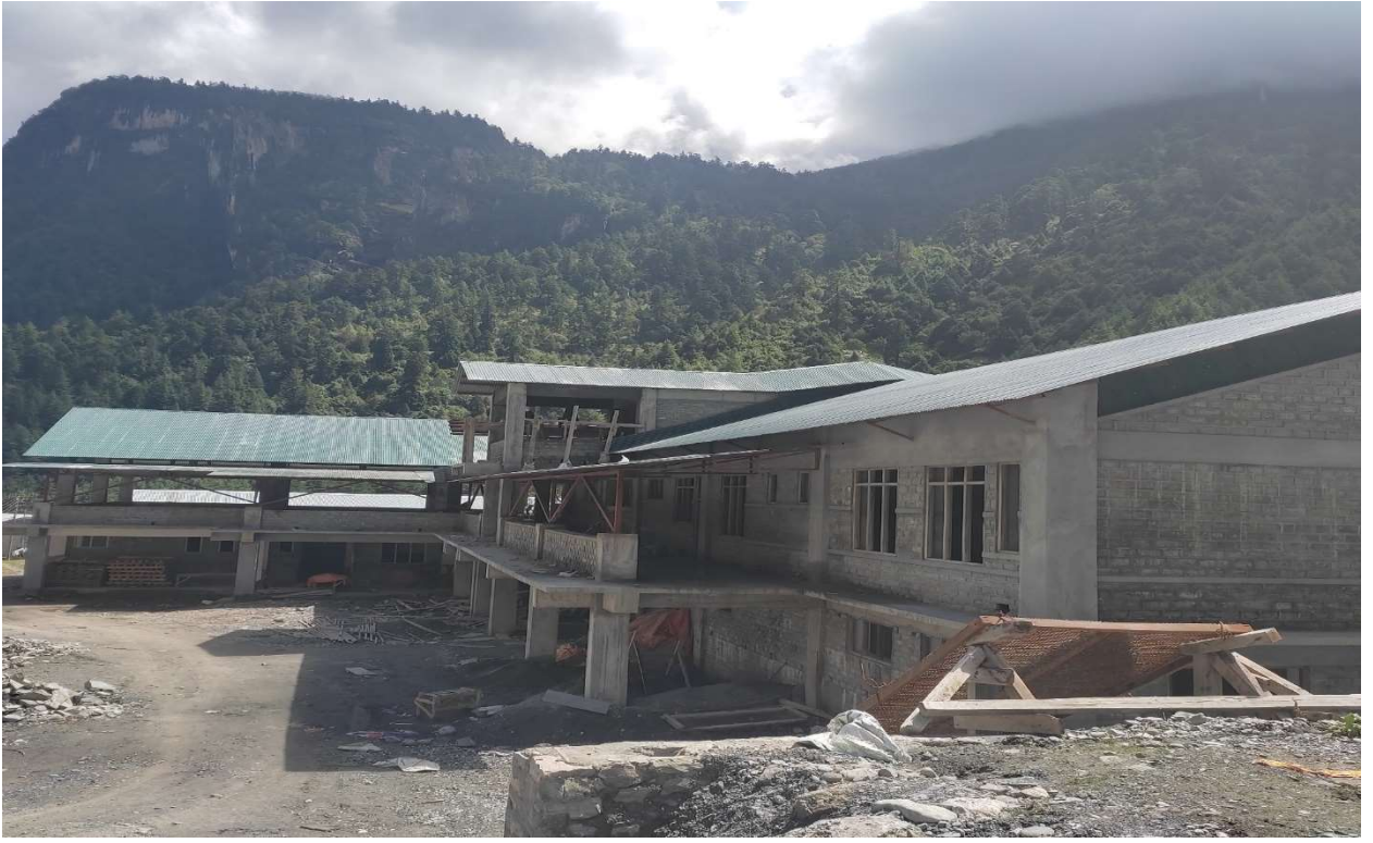
25 शैयाको निर्माणधिन अवस्थामा अस्पतालको भवन